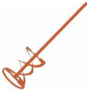
Imagen 1. Marca KWB